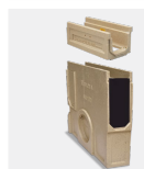
AOCULTO100S + AU100